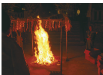
節分厄除大祓神事

11月 かみおきはかまぎ おびとき ごくさい 髪置袴着帯解御供祭 (11月3日)