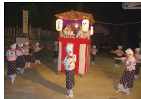
八朔祭 鉄扇音頭奉納