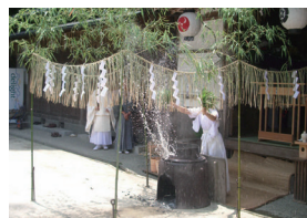
早苗振祭湯立神事